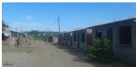
CON APOYO DE YPFB, CONSTRUYEN 51 VIVIENDAS PARA INDÍGENAS

Buscar la sustentabilidad de la empresa, contribuyendo al desarrollo y bienestar social de las comunidades en las que opera.